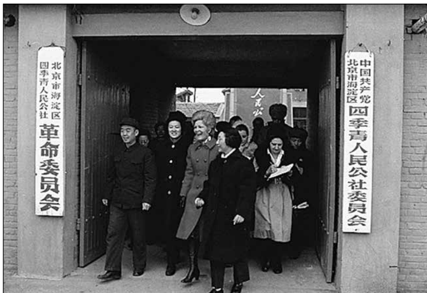
Пат Никсън в Китай в народната комуна „Целогодишна зеленина“ (на 23.02.1972 г.)