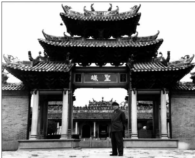
Ст. Райнов в Китай

всички сили на младата социалистическа държава. Като една от десетте монументални постройки 3 , издигнати през същата тази 1959 година по случай десетгодишнината от създаването на КНР, новата 4 Пекинска гара е построена за по-малко от осем месеца (от 20 януари до 15 септември) и е открита от тогавашния върховен партиен и държавен лидер Мао Дзъдун, който символично си купува първия билет за пътуване, а също така собственооръчно изписва калиграфски названието „Пекинска гара“. Пътникопотокът в онзи момент е 200 000 души на ден, а през чакалните на ден вече минават 14 000 пътници. За времето си гарата демонстрира най-високото технологично оборудване, включително 4 ескалатора в една от чакалните и тези ескалатори са първите в Пекин изобщо (те са пренесени от големия търговски център в Шанхай, където асансьорите на входа са разглобени и после са наново сглобени в Пекин). В сградата на пекинската гара е обособена дори зала с легла за децата на пътниците, които чакат дълго – нещо, нечувано и невиждано тогава, а и сега по обикновените гари в Китай. Куполът с височина 35 метра в централната чакалня също