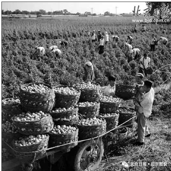
1960 година: членовете на народната комуна събират домати за продажба на пазара