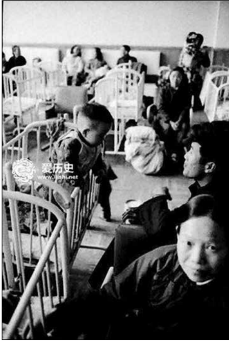
Зала с легла за децата в Пекинската гара