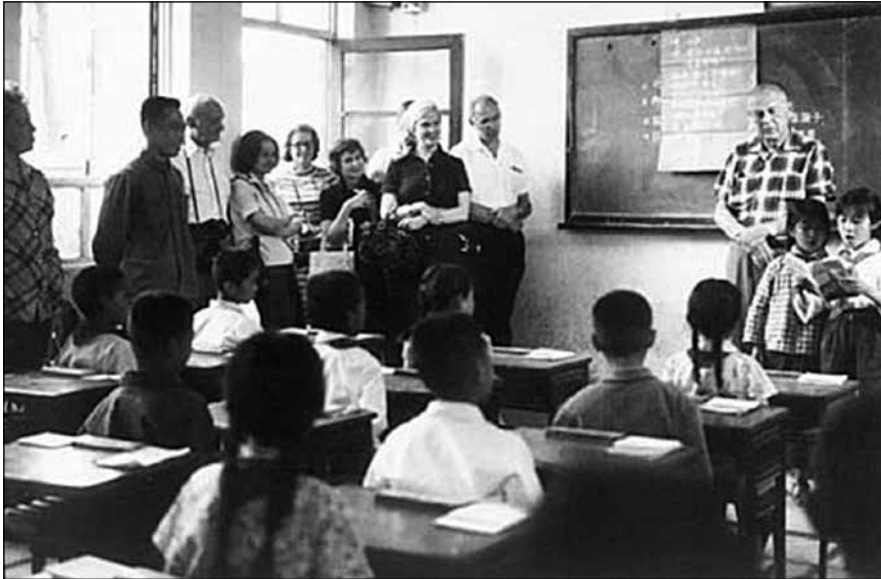
Американски учени на посещение в началното училище в народната комуна „Целогодишна зеленина“

Като цяло обаче съществуването на народната комуна „Целогодишна зеленина“ през следващите години е в унисон със съдбата на всички народни комуни в КНР, които след 1984 година окончателно напускат историческата сцена. На 30 декември 1983 г. комуната официално е преобразувана в административна единица околия Съдзицин 31 (Библиотека на Хайдиен 2020). Тя се оказва в съседство с първата високотехнологична зона на Китай – Джунгуанцун 32 и взема участие с акции в три от четири-