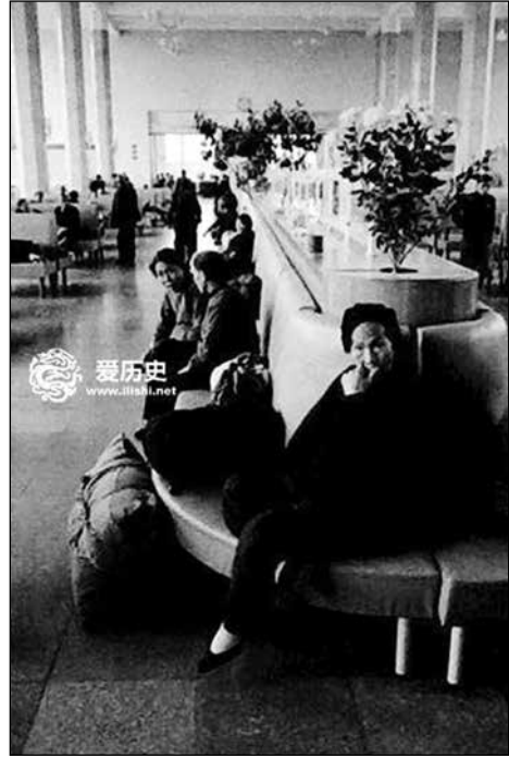
Чакалня в Пекинската гара

е първи в страната, каквито са и инсталираната система с телевизионни екрани за информация, а също и автоматичните телефони на пероните (Дзин, Ма 2019).