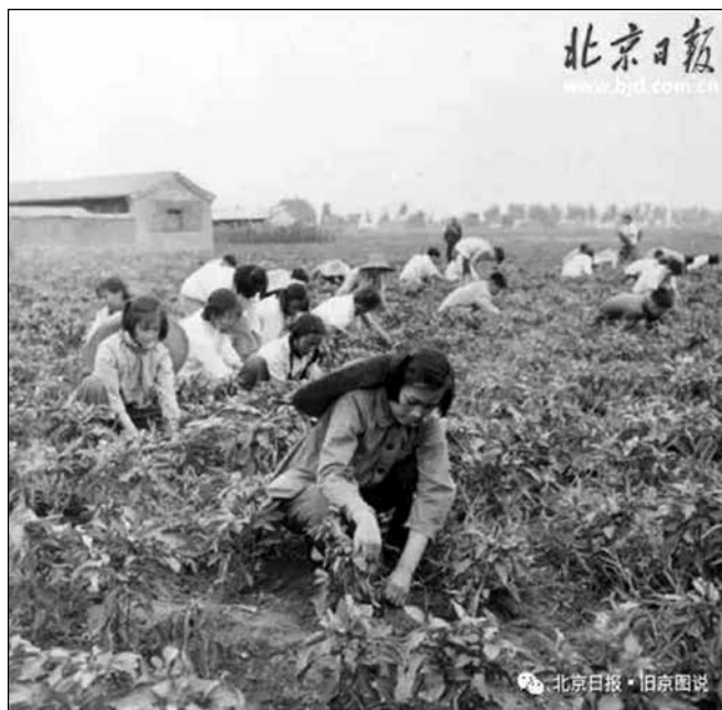
1960 г. – ученици от 44 средно училище плевят зеленчуковите площи в Народната комуна на китайско-българската дружба „Целогодишна зеленина“

В един човешки и конкретен план обаче е по-интересно какво се случва с „нашата“ комуна след посещението там на Стоян Райнов, затова издирих и предлагам редица свидетелства за нейната съдба до наши дни.