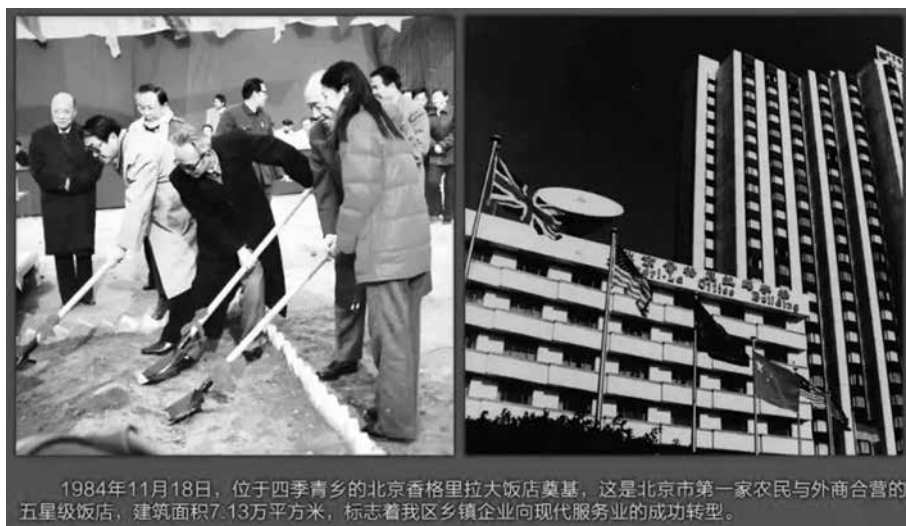
Хотел Шангрила-Пекин през 1984 г. и днес

те най-успешни фирми в тази зона. Началният капитал от 20 000 юана за най-известната компания „Сътун“ е предоставен именно от околия Съдзицин, а първият председател на компанията е кметът на същата тази околия (Библиотека на Хайдиен 2020). Друг впечатляващ жалон от устрема на Съдзицин към модернизиране и благосъстояние е издигането на петзвездния хотел „Шангрила-Пекин“ през 1984 година 33 на територията на бившата народна комуна „Целогодишна зеленина“ със средства на едно от първите в Пекин джойнт венчър сдружения с чуждестранно участие (Джан 2019). В името на хотела, редом с обичайната асоциация с легендарната райска страна се прокрадва и буколическото идеализиране на едновременната прославена комуна, „превърнала зимата в пролет“ (Библиотека на Хайдиен 2020) и осигурявала през 60-те години на 20 век пресни зеленчуци за трапезите на милиони семейства в Пекин и съседните райони.